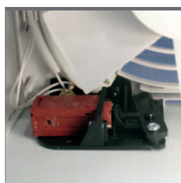
Termoattuatore per l'apertura elettrica delle alette