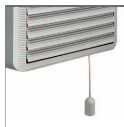
Versione con apertura manuale (interruttore a corda)